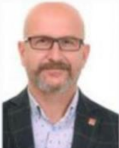
İbrahim DEMİRCİOĞLU CHP